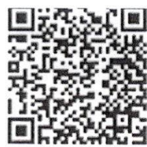
QR Code ประชุมวิชาการ