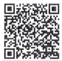
QR Code การลงทะเบียน