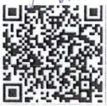
QR Code Pre-congress